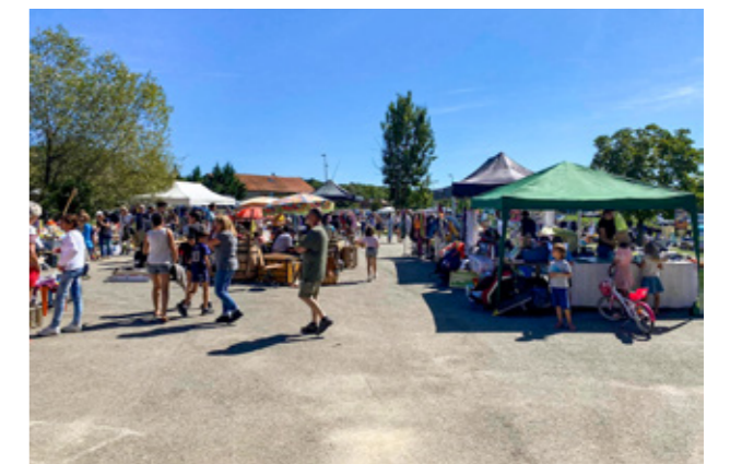
Le bureau de l'APE du Triolet

Retrouvez-nous sur notre site internet : www.apeletriolet.com et sur Facebook : Ape le triolet